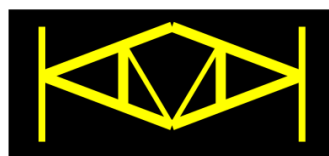
Fundacja Obrony Praw Dziecka KAMAKA