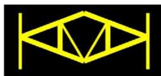
Fundacja Obrony Praw Dziecka KAMAKA