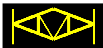
Fundacja Obrony Praw Dziecka KAMAKA